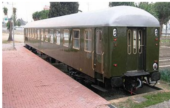
Muchos de los revestimientos de los antiguos vagones, estaban compuestos de amianto.